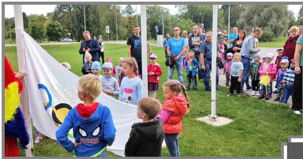
Olimpiskā karoga pacelšana

Kā jau katrās Olimpiskajās spēlēs notiek svinīga karoga pacelšana, arī mūsu pasākumā mastā tika uzvilktis Mārpuķītes īpašais Sporta spēļu karogs, kuru pagalmā ienesa pārstāvji no katras grupiņas. Pie bērniem un pieaugušajiem šogad ciemos bija ieradies papagaillis, kurš atnesa vēstules – kartes, pēc kurām labāk orientēties tuvākajā apkārtnē. Katrai no grupām bija jāizvirza savs komandas kapteinis, kurš bija atbildīgs par kartes nogādāšanu no viena kontrolpunkta uz otru, par zīmodziņa iespiešanu