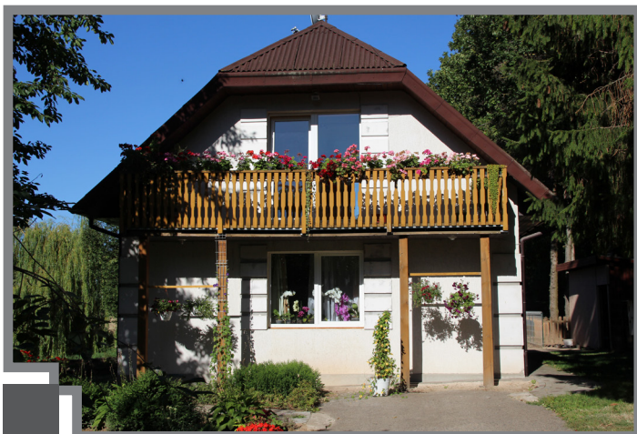
Rundāles pagasta Mintauta Buzēna "Avotiņi"

Konkursa "Sakoptākā sēta" vēsture mūspusē mērāma jau vairāk nekā desmit gadu garumā, meklējot un izceļot novada sakoptākās vietas.