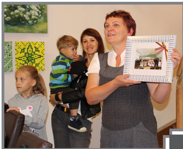
Projekta noslēguma pasākumā “Baltajā mājā” 18.septembrī pulcējās projekta dalībnieki no Latvijas un Lietuvas, lai novērtētu veikumu un pateiktos projekta partneriem