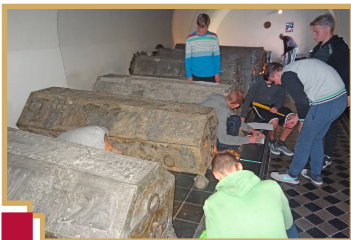
Sarkofāgu restaurācija nav vienkāršs process – viena no panākumu atslēgām – precīza mērīšana un tāmes sagatavošana