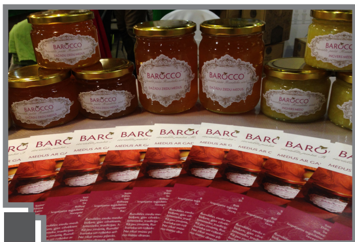
Medus jaunais dizains un iepakojums. Medum dots nosaukums “Barocco”, kas saista to ar izcelsmes vietu Rundāli