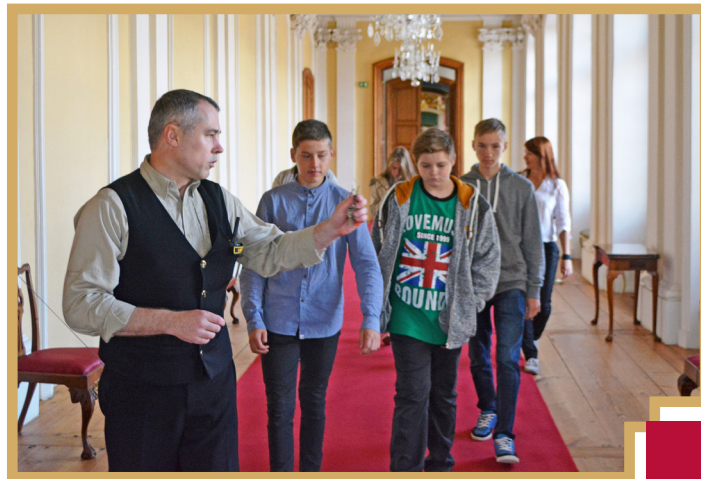
Pils apsardzes moto – vēlreiz un vēlreiz visu kārtīgi pārbaudīt un pārliecināties par pils dārgumu drošību

Meitenes atklāj, ka redzētais un uzzinātais ļoti patīcis – gan ģērbt mazuļus, gan doties pastaigā. Abas meitenes labprāt vēlētos vēlreiz ēnot šajā