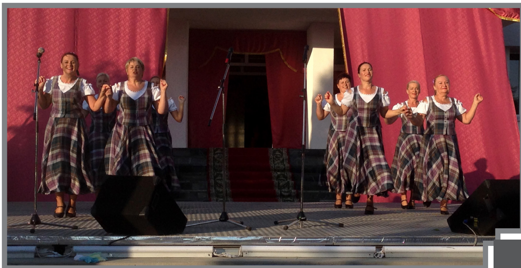
“Ir variantu” dejotājas

“Dalībnieces bija ļoti nopietni gatavojušās šim konkursam. Tas sastāvēja no trim daļām – vizītkartes demonstrēšanas, talanta atrāšanās un pašu da-