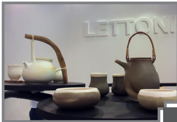
Laimas tējkannas izceļas ar neparastu dizainu un individualitāti

"Pēc studijām Lielbritānijā, esmu atgriezies bērnības mājās Rundāles novada laukos, lai izveidotu atvērto keramikas darbnīcu un mākslinieku rezidenci- Mālotavu. Laikā, kad visapkārt valda masu produkcija, esmu nolēmusi dot savu artavu, lai censotos izdaļot cilvēku ikdienu ar tik