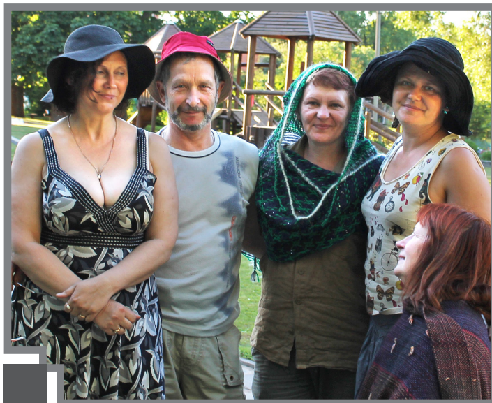
Lauras Ikeretes gleznošanas studijas pārstāviji kopā ar projekta organizatoriem