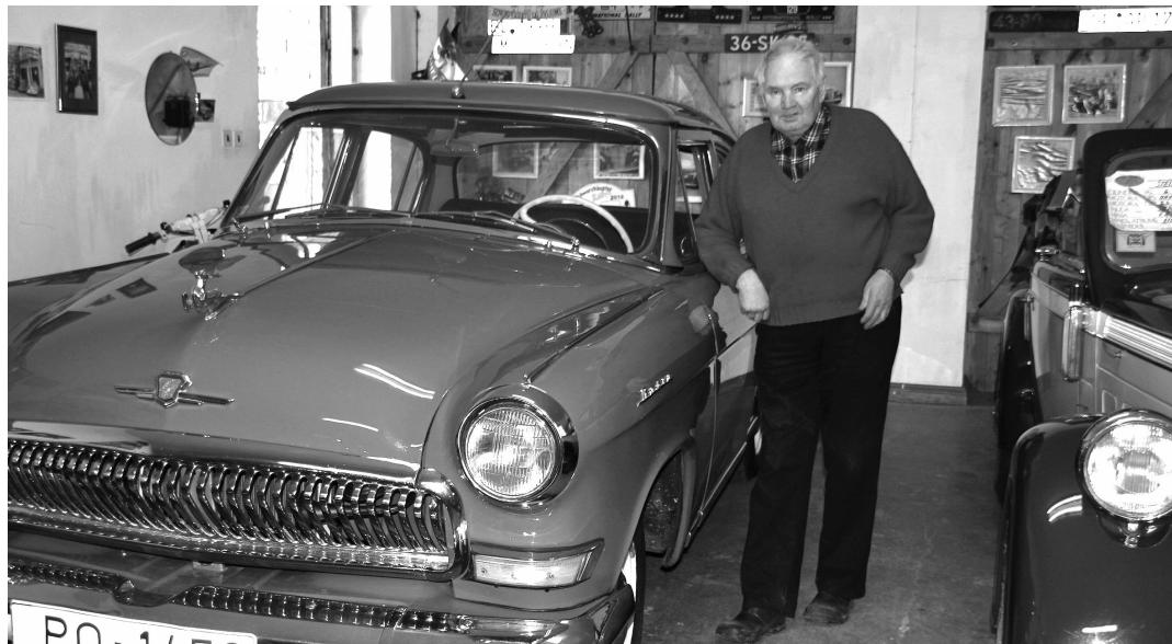
F: Ilgi kārotā sarkanā 1958.gada Volga GAZ 21 lēpni ieņem savu vietu starp kolekcionāra dārgumiem

Ar katru automobili saistās kāds īpašs stāsts, ko papildina fotoattēli ģimenes albumā. Sarkanā Volga glabā atmiņas par di-