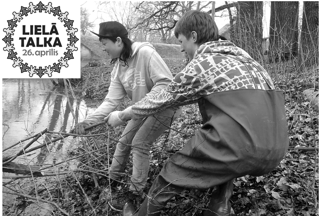
☒ Katru gadu Lielajā talkā aktīvi iesaistās arī novada nevalstiskās organizācijas. Attēla: "Mums pieder pasaule" jaunieši kopj Svitenes upes krastus