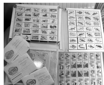
F: Unikāla sērkociņu kastīšu kolekcija. Vecākā kastīte - 1965.gada ražojuma