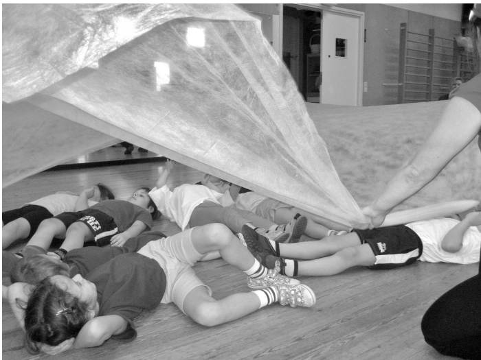
F: Bērni jo īpaši iecienījuši kustību rotaļu "Paslēpjamies no sniedzina", kas ietver sevi gan veiklības, gan spēles elementus