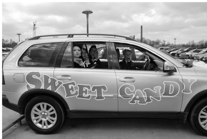
F: Gatavojoties pasākumam, īpašu noformējumu ieguva arī dalībnieču automašīna – košas uzlīmes uz sāniem un skaistu dekorējumu uz mašīnas priekšpusi.

Finišā dalībnieces ieradās bez 2 minūtēm septiņos vakarā. Pirmo vietu rallijā ieguva komanda "X Sports", kas startēja jau sestoreizi. "Arī mēs tagad saprotam,