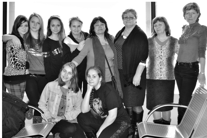
F: Pilsrundāles vidusskolas projekta grupa Varšavas lidostā

Bija patīkami vērot talantīgos vienaudžus. Gribējās arī pašām pēc iespējas labāk pilnveidot savas dziedāšanas un dejošanas prasmes. Pēc Polijā pavadītās nedēļas ir iegūti daudzi jauni draugi. Palikušas jaukas atmiņas par darbīgi un interesanti pavadīto laiku poļu ģimnāzijā."