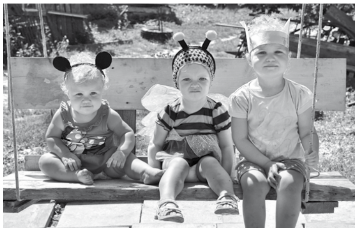
Mikipele, bitīte un viens no trim sivēntiņiem – tikai daži no pasaku ballītes dalībniekiem