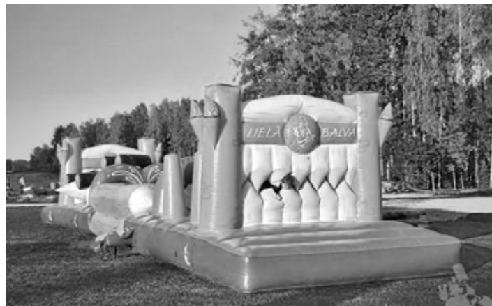
Viena no sporta spēlēs piedāvātajām atrakcijām - INKVIZĪCIJA -garantē pozitīvu izklaidi visiem dalībniekiem

2.augustā plkst. 10:00 Pilsrundāles vidusskolas sporta laukumā sportiski azartiskā gara tiks aizvadītas tradicionālās Rundāles novada Vasaras Sporta Spēles.