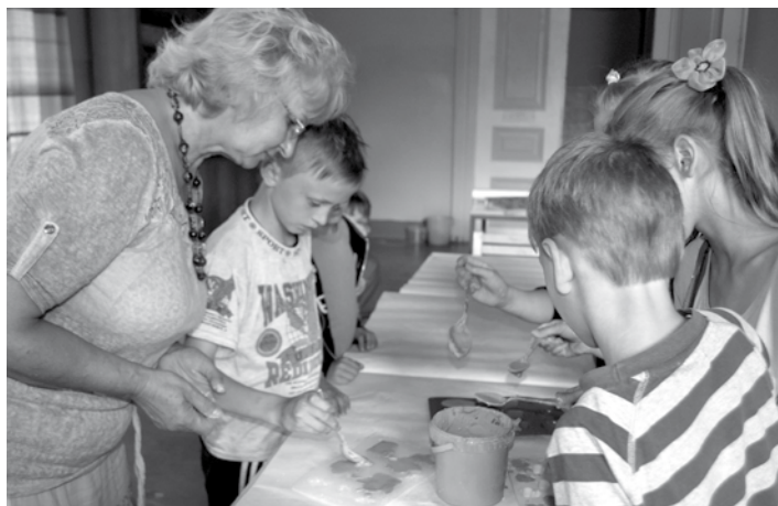
Vizuāli plastiskās mākslas nodaļas dalībnieki vienmēr atvērti jaunajam – ziedu veidošanai no ģipša

Paralēli meistarklasēm un darbam pie noslēguma uzveduma, notika arī pedagoģu darbs ar apdāvinātākajiem audzēkņiem, sniedzot iespē-