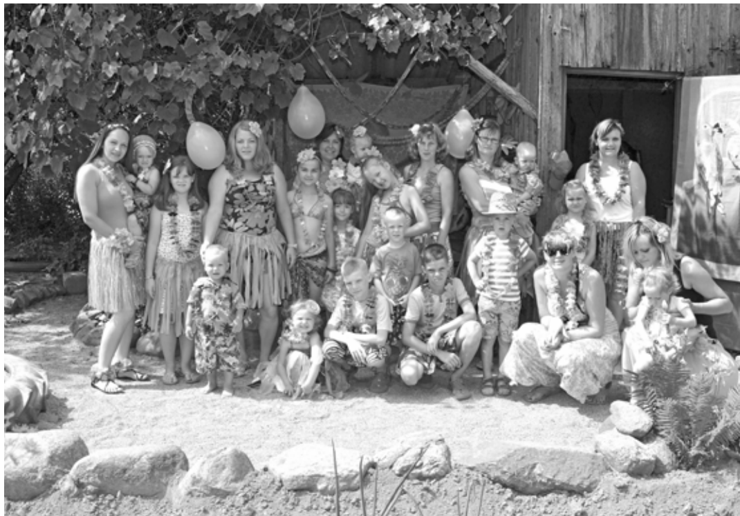
Havajiešu ballītē tika piedomāts ne tikai pie apģērba, bet arī pie kopējā noformējuma – banānu koki, ziedu vītenes, baloni un īpašie tropiskie ēdieni un dzērieni

„Pilsrundāles māmiņu klubs” - tā mūs jau daudz