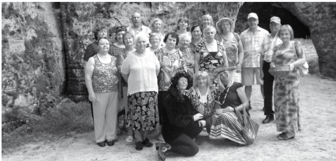
Divu dienu ekskurija bija piepildīta gan pozitīvām emocijām, gan dažādiem pārsteigumiem.