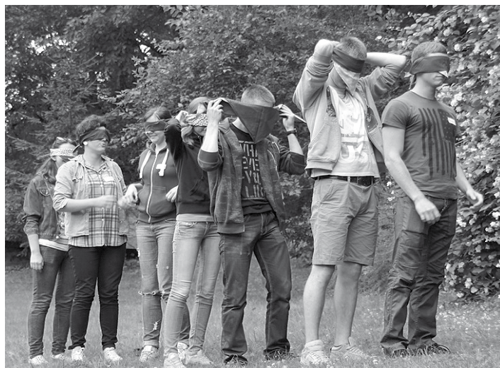
Liela daļa uzdevumu semināra ietvaros veidoja jauniešiem priekšstatu par komunikācijas nozīmi komandā, jo uzdevumi bija veicami ar aizsietām acīm un nesarunājoties