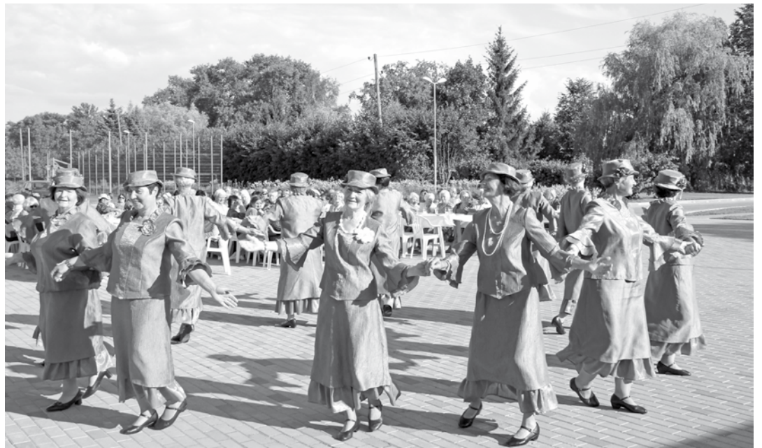
Ar vieglumu un staltu stāju pasākumu izdejoja Magnoliju dāmas

18.jūlijā pie Pilsrundāles vidusskolas notika tradicionālā Rundāles novada pensionāru balle „Virši zili, virši sārti”, pulcējot vairāk nekā 180 novada seniorus.