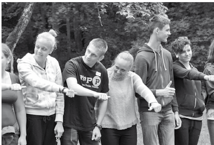
Kopīgs darbošanās process uzdevuma mērķa sasniegšanai

JAUNATNES STARPTAUTISKO PROGRAMMU AĢENTŪRA