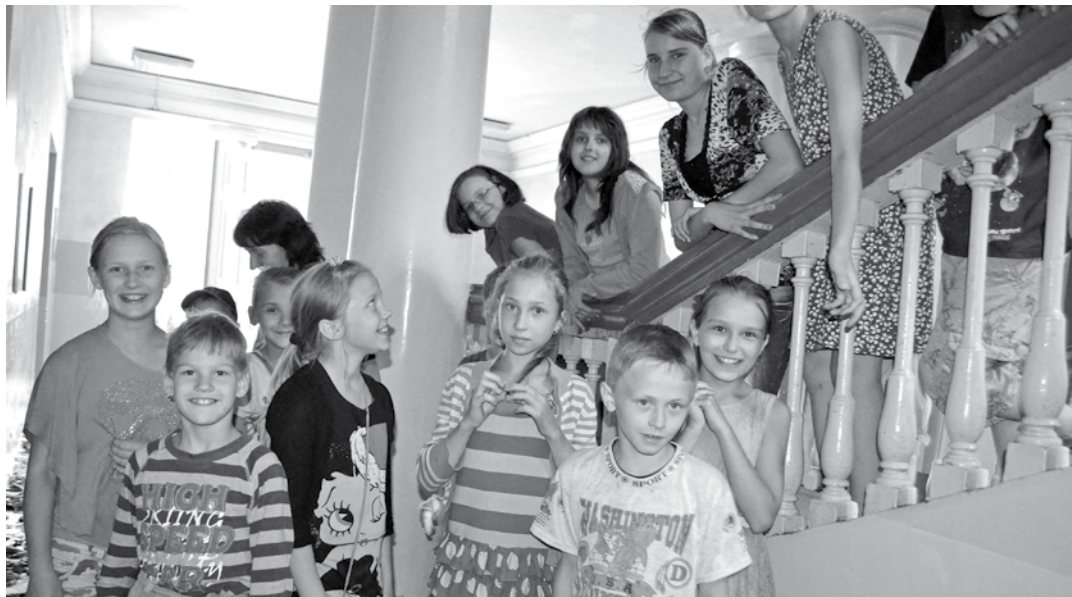
“Allaž smaidīgie un pozitīvi uzlādētie Mūzikas un mākslas skolas audzēkņi”

Ļoti garšīgi, izdabājot katru audzēkņa vēlmēm gan porcijas lielumā, gan ēdiena izvēlē, gatavoja mūsu pavārites - Līga un Līgita.