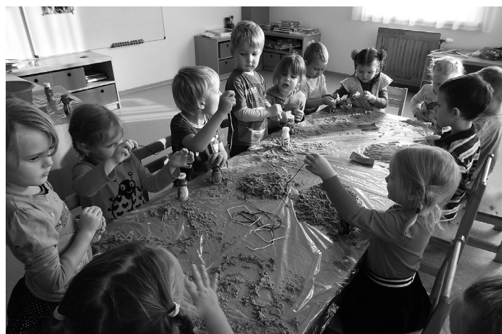
Sarkanās grupas bērni gatavo hantelītes

Piektdiena – nedēļas noslēgums, aicinājām visus: "Esī saudzīgs, draudzīgs un līdzjūtīgs!"