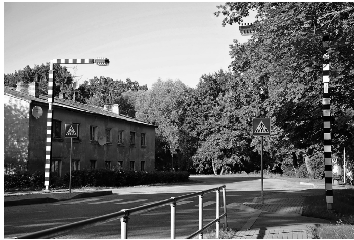
Svitenes gājēju pāreja, celiņš un barjeras izbūvētas ar Eiropas Savienības fondu atbalstu

Satiksmes drošības uzlabošana Svitenē tika veikta ar Eiropas Reģionālā fonda līdzfinansējumu, kā arī ņemot vērā visus normatīvos aktus un tajos noteiktās prasības attiecībā pret drošības jautājumiem.