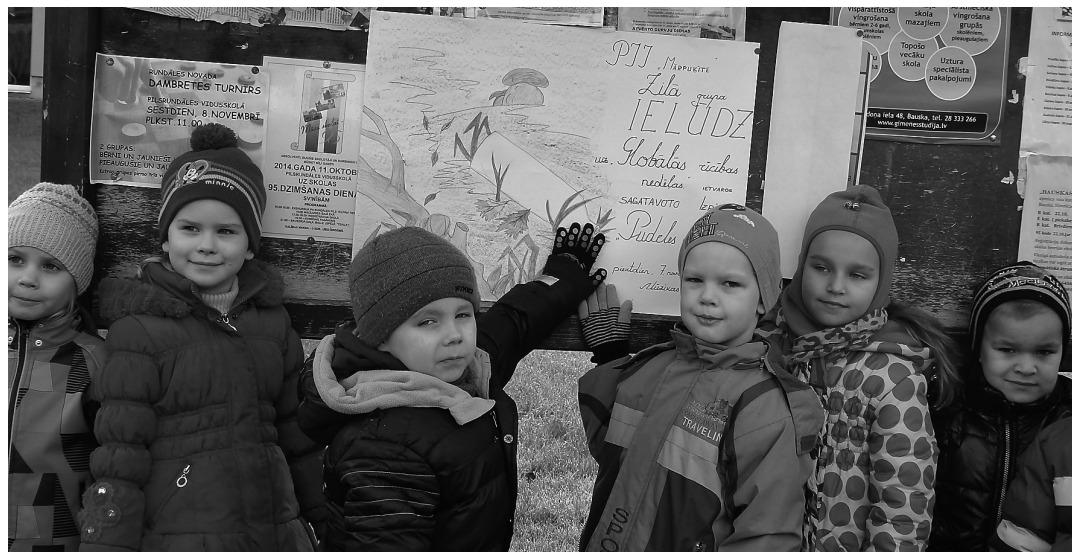
Zilās grupas bērni izvieto afišu pie Saulaines ziņojumu stenda

Otrdienas darbi ritēja ar domām: "Krāj, šķiro un nodod!" Grupās turpinājās pirmdien iesāktais darbs. Gatavoja un noformēja makulātas kastes, kurās