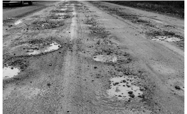
Rundāles novads @RundaleLV · Nov 3 @Sat_Min Jautājums par ceļu Pilsrundāle - Svītene - Klieņi? Kad paredzēta rekonstrukcija? Lietavās - neizbraucamell

Šis variants ir realizējams tikai cieši sadarbojoties ar Svītenes uzņēmējiem un zemniekiem. Programmas nosacījumi paredz, ka arī uzņēmējiem ir jāsniedz fondu atbalstam savus investīciju projektus. Naudas summas apjoms, kas tiks piešķirts ceļa rekonstrukcijai vai asfaltēšanai, būs atkarīgs no uzņēmēju projektos paredzētajām investīcijām. Tāpat tiek plānots, ka par vienu uzņēmēja radīto darbavietu, būs iespējams saņemt 41 000 EUR ceļu rekonstrukcijai. Papildus informāciju par jaunā plānošanas perioda fondu fi-