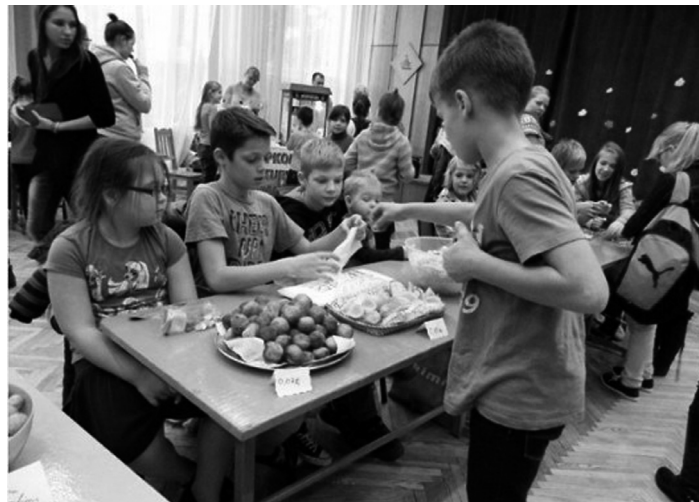
Attēlā augšā: Lāčplēša kausa izcīņa – pārvietošanās gāzmaskās. Attēlā lejā: Tradicionālais Mārtiņdienas tirgus

Pilsrundāles vidusskolas sporta sacensības ”Lāčplēša kauss” notika Pilsrundāles vidusskolas apkārtnē 2014.gada 7. novembrī. Sacensības organizē LR Rekrutēšanas un Jaunsardzes centra Jaunsardzes departamenta 3.novada nodaļas Jaunsargu 508.vienība sadarbībā ar Pilsrundāles vidusskolu.