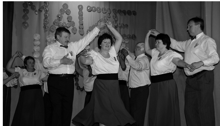
Deju kolektīvs "Šurpu turpu" ar deju "Nāc dejot"

17.novembrī Svītenē Latvijas Republikas Proklamēšanas gadadiena tika atzīmēta ar koncertuzvedumu "Maize ir kā pasaule" pēc Imanta Ziedoņa "Poēmas par maīzi".