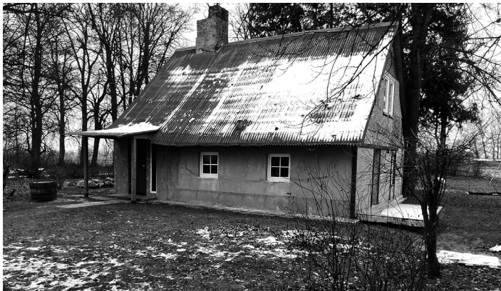
Šobrīd no agrākajiem Kalnanzēniem palikusi vien puse, otru nopostījis kritis koks