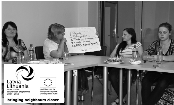
Attēlā: Stratēģijas publiskā apspriešana 28.maijā Svitenē

Nav noslēpums, ka uzņēmēji ir retākie apmeklētāji bibliotēkās. Projekta teritorijai raksturīgas kopīgās uzņēmējdarbības nozares – lauksaimniecība, alus, iesala un kvasa ražošana, kā arī tūrisms, it īpaši piļu un muižu kultūrtūrisms.