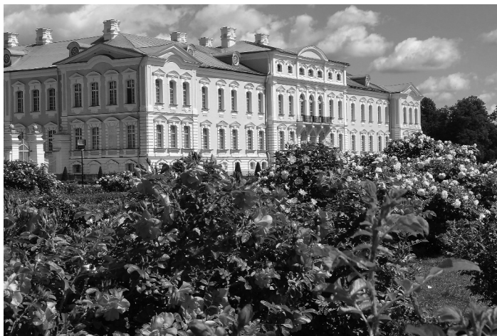
Attēlā: Latvijas selekcionāru rozes.

Krokoto rožu kolekcijā plaši pārstāvētas Vācijas, Francijas, Zviedrijas, Somijas,