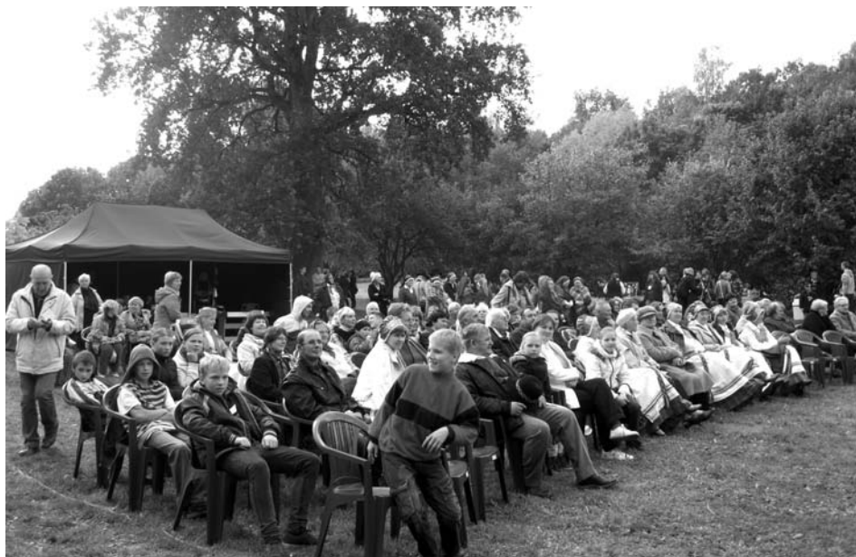
Lielajā Miķeļdienas andelē Svitenē Saules dārzā pulcējās skatītāji no visa novada un amatierkolektīvi gan no Latvijas, gan Lietuvas, kopā pavadot dienu dziesmās, rotaļās un dejās.

Kā katru gadu – rāpšanās umurkumūrā izraisīja lielu interesi, līdz pasākuma beigām astoņas reizes tika nokļūts līdz balvām, liecinot par to, ka apmeklētāju vidū netrūkst stiprinieku un izveicīgu cilvēku.