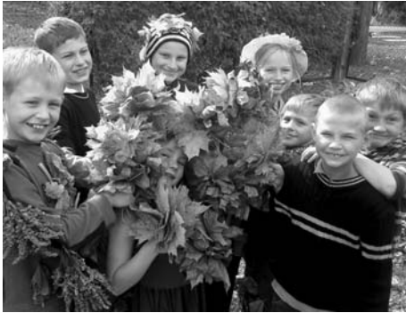
Attēlā: 2.un 4.klases Bērsteles skolas skolēni