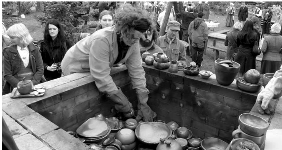
Cepla atvēršana Baltajā mājā.

Trīs dienas no 28.-30.septembrim Rundāles novada Pilsrundālē notika pirmais Zemgales stāstnieku festivāls ar nosaukumu „Gāž podus Rundālē!”. Tas bija ilgi lolots un gaidīts pasākums, kurā piedalījās gan kā mājas saimniece, gan kā stāstniece, jo Pilsrundāles bibliotēka ir viena no 18 Latvijas bibliotēkām, kura nes UNESCO LNK Stāstu bibliotēkas nosaukumu.