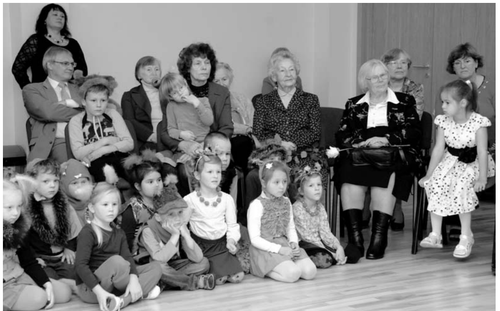
Attēlā: Pensionēto pedagogu svinīgā pieņemšana PII „Mārpuķīte” 5.oktobrī

„Tas parāds Jums ir nenodzēšams, Un rudens puķes arī šogad skums. Mēs varam vienīgi tā dzīvot, Lai parādā kāds paliek mums.”