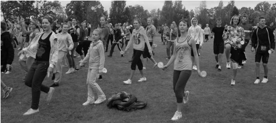
Pilsrundāles vidusskolas skolēnu un skolotāju kopīgā rīta rosme 28.septembrī

Rudens ir laiks, kad dabas krāšņums ir īpaši dāsns – ar asterēm, dālijām, zelt-sarkanām kļavu lapām. Pilsrundāles vidusskolā septembra mēnesis ir notikumiem bagāts un rudenīgu motīvu caurstrāvots.