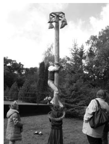
Skatītājiem tika piedāvātas dažādas izklaides – gan izsolīti sīpoli, kāposti, sivēns un zoss, gan piedāvāta rāpšanās umurkumūrā (veiksmes stabā) pēc vērtīgām balvām.