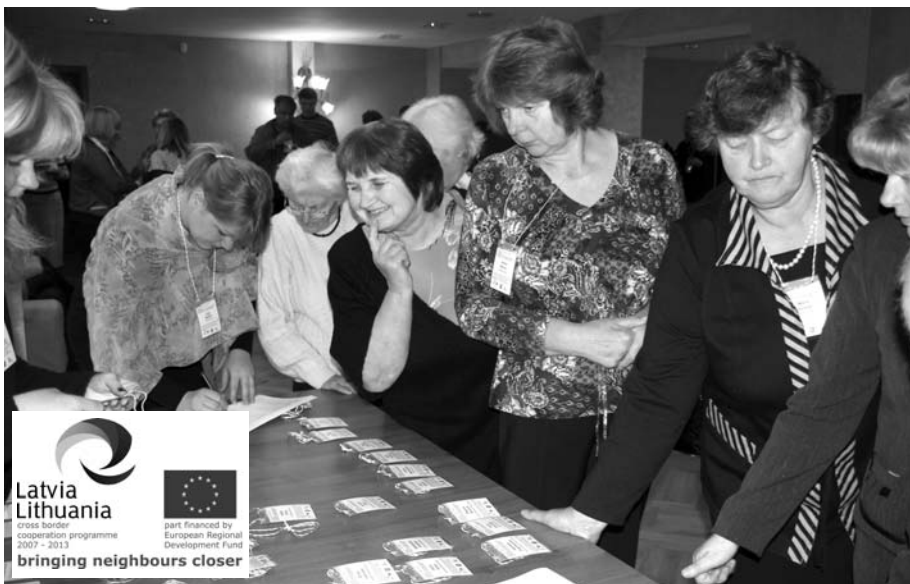
Attēlā: Rundāles novada dabas vērotāji seminārā 9.oktobrī Bauskā, Bērzkalnos

Seminārs par sabiedrisko vides monitoringu