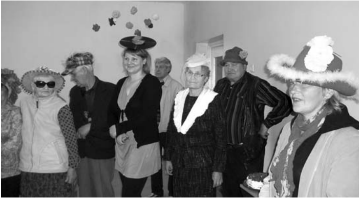
Pasākuma „Jautrais Miķelis” dalībnieces Viesturu kultūras centrā 28.septembrī

Apvienības „Vakarvējš” pasākums „Jautrais Miķelis” pārsteidza ar cepuru skaistumu un daudzveidību