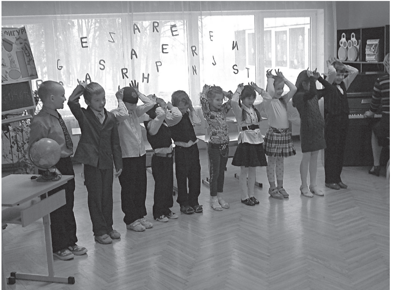
Pilsrundāles vidusskolā un tās struktūrvienībās 1. klašu skolēni nosvinējuši savu 100. dienu skolā. Attēlā Bērsteles skolas pirmklasnieki tradicionālojos Burtiņu svētkos š.g. 11. februārī Plašāk par to lasiet 5. lpp

Aivars Okmanis Rundāles novada domes priekšsēdētājs