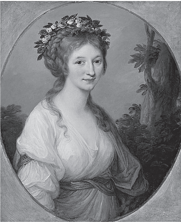
Attēla: Angelika Kaufmane. Kurzemes hercogienes Annas Šarlotas Dorotejas Mēdemas portrets. 1785.

Janvāris Rundāles pilī tika aizvadīts svinīgās noskaņās, jo notika gatavošanās izstādes „Dievinātā Doroteja” atklāšanai. 2011.gada 3.februārī, atklājot minēto izstādi, tika atzīmēta Kurzemes hercogienes Annas Šarlotas Dorotejas 250 gadu jubileja. Izstādē atspoguļota hercogiene Doroteja dažādu mākslinieku skatījumā un rakstos.