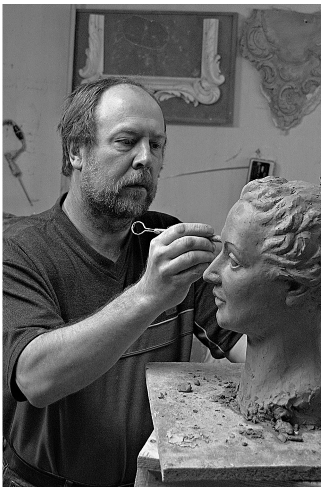
Manekena izgatavošana 18.gadsimta tērpiem

Kamēr Rundāles pilī ir daudz darba, tikmēr mazāk skatāms uz citiem pasūtījumiem. Mums ir jāreķinās ar pašreiz esošajiem darbiem, jo restauratoru nav tik vienkārši piesaistīt – viņu nav daudz. Ja paralēli darbiem pie Rundāles pils restaurācijas būtu jārealizē vēl kāds liels pasūtījums, es nezinu, vai izdotos piesaistīt veselu brigādi, kuri uzreiz spētu restaurēt tēlniecības darbus vai gleznojumus.