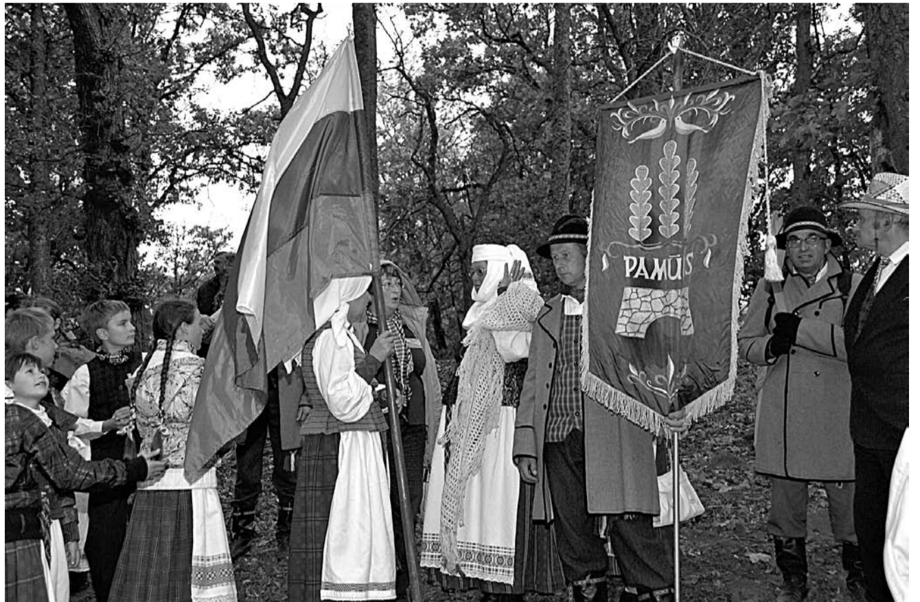
22. septembrī Baltu vienības dienai veltītajā pasākumā „Baltu saule” Mežotnes pilskalni piedziedāja folkloras kopas no Latvijas un Lietuvas

Ceturtdien, 22. septembrī ar gājēju tilta pāri Lielupei uz Mežotnes pili atklāšanu, aizsākās Baltu vienības dienai veltītais pasākums „Baltu saule”. Baltu vienības apzināšanai un stiprināšanai katru gadu 22. septembrī Latvijā un Lietuvā ir kopīgi svētki – abu valstu atzīta Baltu vienības diena. 1236. gada Rudens saulstāvjos Saules kaujā mūsu senči - baltu ciltis - vienotībā iznīcināši sakāva Zobenbrāļu ordeni.