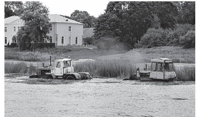
Lielupes upes gultnes tīrīšana šā gada augustā un septembrī