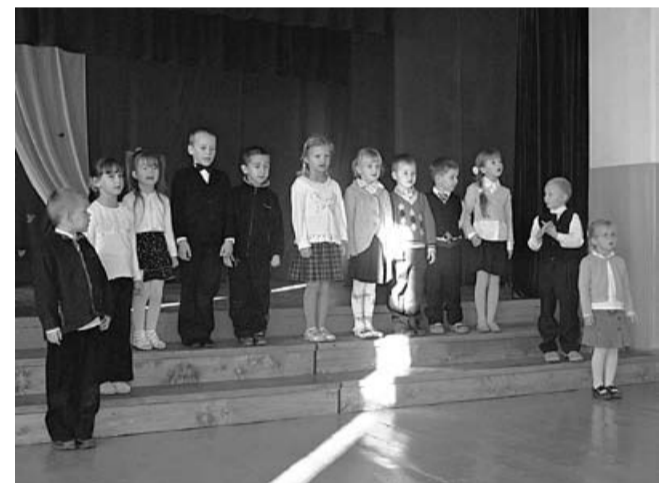
5/6 gadīgo bērnu grupa 18. novembra koncertā

1919.gada 11.novembris – diena, kad Latvijas armija no Rīgas padzina uzbrucēju karaspēku. Simboliski šo dienu uzskata arī par Lāčplēša Kara ordeņa dibināšanas dienu. Augsto apbalvojumu, kura devīze ir “Par Latviju”, piešķir Latvijas armijas karavīriem, bijušo latviešu strēlnieku pulku karavīriem, kā arī ārzemniekiem, kuri piedalījās Latvijas brīvības cīņās. Godinot latvisko patriotismu, karavīru drosmi, cīņas spar un brīvības cīņās kritušos, Svitenes skolēni dienā izdziedāja dziesmas par savu zemi Latviju, pārrunāja vēstures notikumus, bet vakarā devās sveicīšu gājienā pie piemiņas akmens.