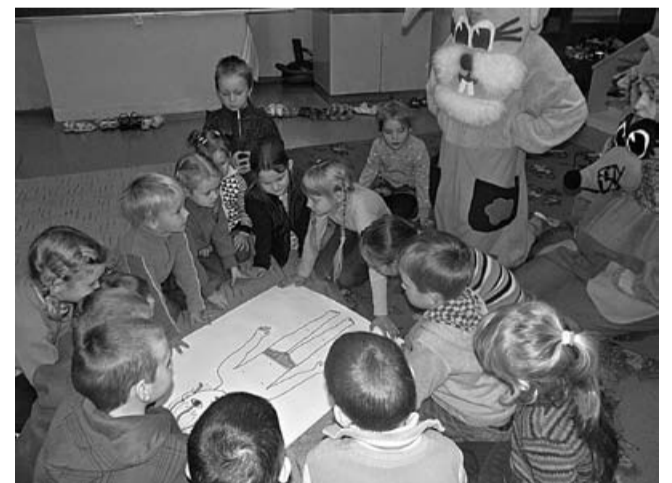
Svitenes skolā viesojās Zaķis un Ezis

Valsts svētkus - 18.novembri mūsu skolā ir nerakstīts pienākums godināt, dziedot valsts himnu un sniedzot svētku koncertu. Priekšnesumus gatavojām visi pirmsskolas grupu bērni un 1.-4.klašu skolēni. Trīsgadīgajiem bērniem tā bija pirmā uzstāšanās uz skatuves, kas sekmēja bērna pašapziņas, savu spēju, pozitīvas attieksmes veidošanos pašam pret sevi, citiem cilvēkiem, apkārtējo vidi un Latvijas valsti.