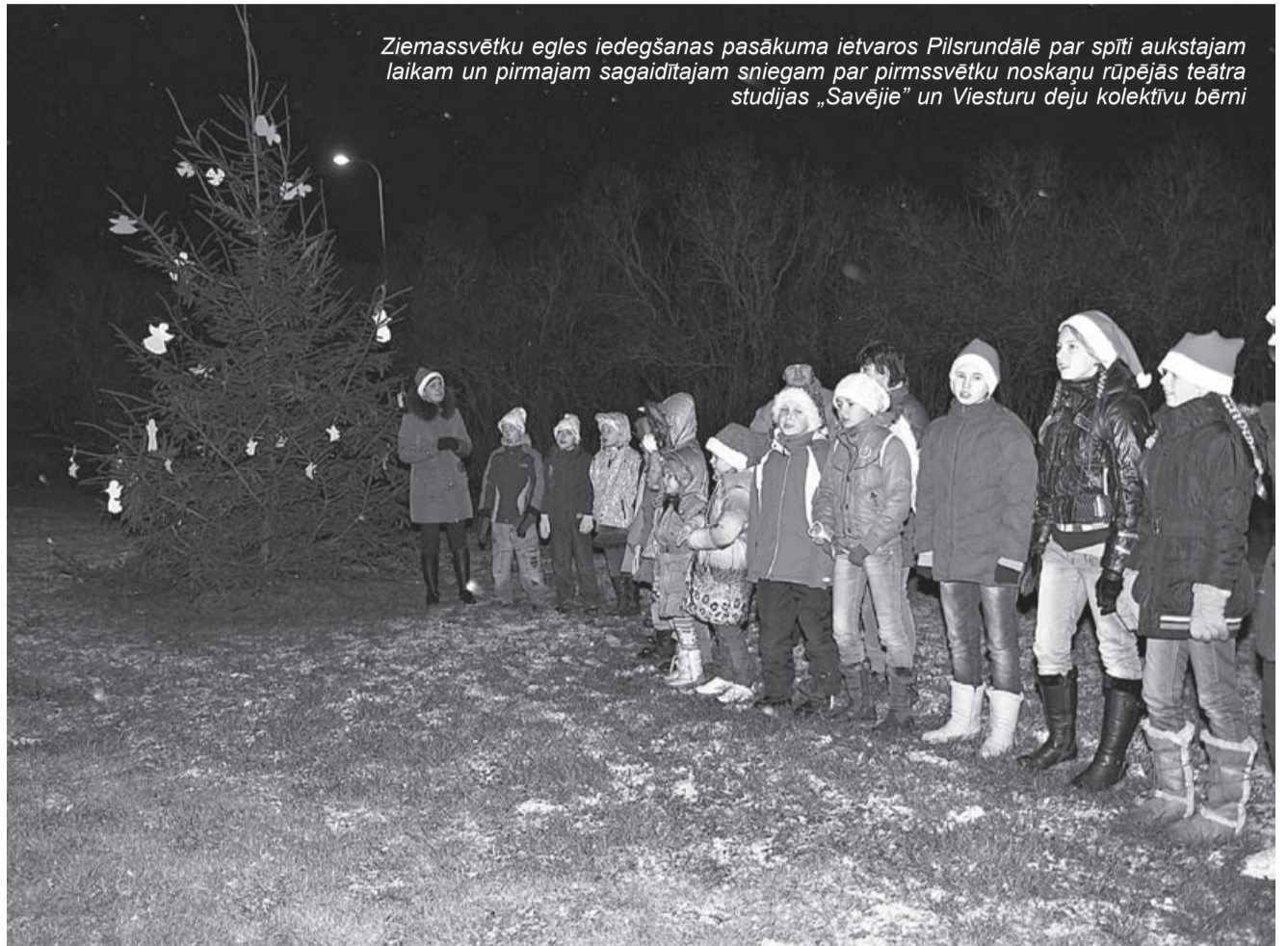
Ziemassvētku eglis iedegšanas pasākuma ietvaros Pilsrundālē par spīti aukstajam laikam un pirmajam sagaidītajam sniegam par pirmssvētku noskaņu rūpējās teātra studijas „Savējie” un Viesturu deju kolektīvu bērni