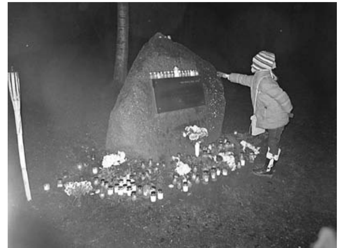
„Audzi, Latvija, audzi, Audzi jaunajās audzēs,” – skan skolēnu teiktās dzejas rindas pie piemiņas akmens Lāčplēša dienā

Lāčplēša diena ir viena no tām nedaudzajām mūsu atceres dienām, kad svinam uzvaru!