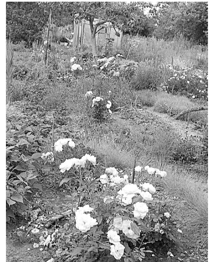
Pilsrundālē gandrīz nemaz nebija tādu dārzu, kur neaugtu dažādi ziedi

Kā pirmos komisija vērtēja Pilsrundāles ciemata mazdārziņus. Pirmais iespaids bija pārsteidzošs – neskatoties uz to, ka jau vairākus gadus dzīvojam „dižķibeles” apstākļos, daudzos mazdārziņos bija tikai ziedi, ziedi un ziedi. Īpaši krāšņi visā savā godībā izcēlās lilijas, visnieedomāmākā krāsu gammā - sākot ar baltu un beidzot ar tumši brūnu, gandrīz melnu krāsu.