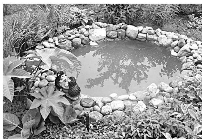
Pie dārza dīķa iemitinājusies ezišu ģimene