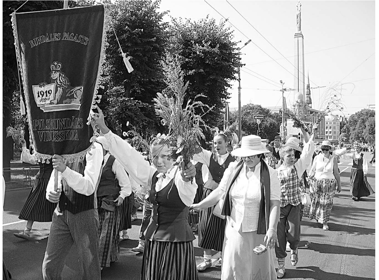
Rundāles novada Pilsrundāles vidusskolas brašie dejotāji X Latvijas skolu un jaunatnes dziesmu un deju svētku gājienā

Plašāk par svētku dalībnieku piedzīvoto lasiet 6.lpp