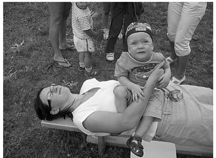
Vienas minūtes laika noteikšanai „Dižliepas” titula pretendētēm jāva izmantot arī palīgus – tikai pašus mazākos