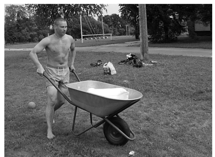
Slaloms ar ķerru cīņā par „Dižozola” titulu