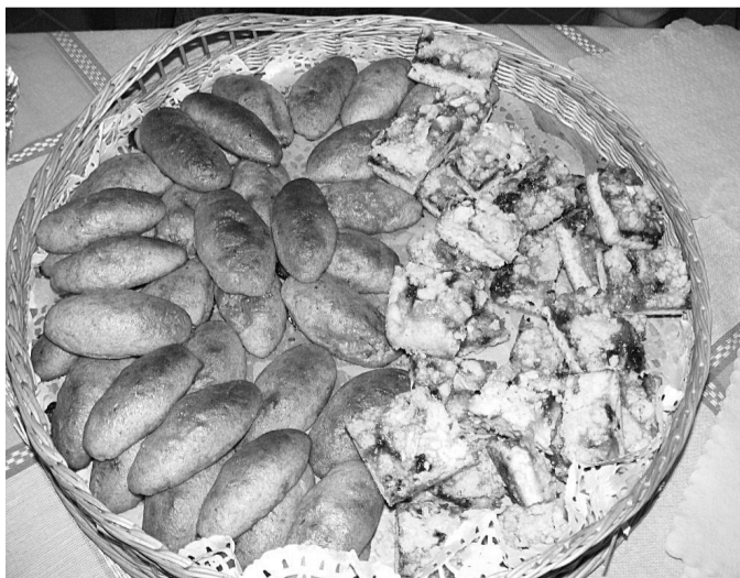
Tradicionālie zemgaļu tumšie pīrāgi un ogu drupačmaize pārstāvēja kulināro mantojumu no Latvijas