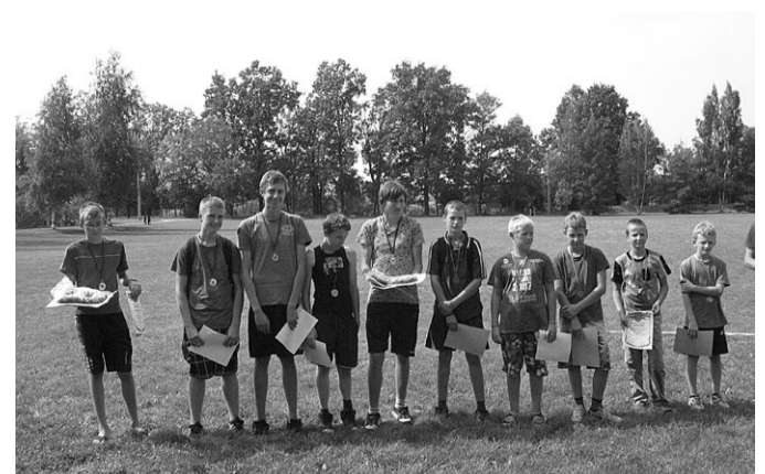
Veiklākie futbola spēlētāji