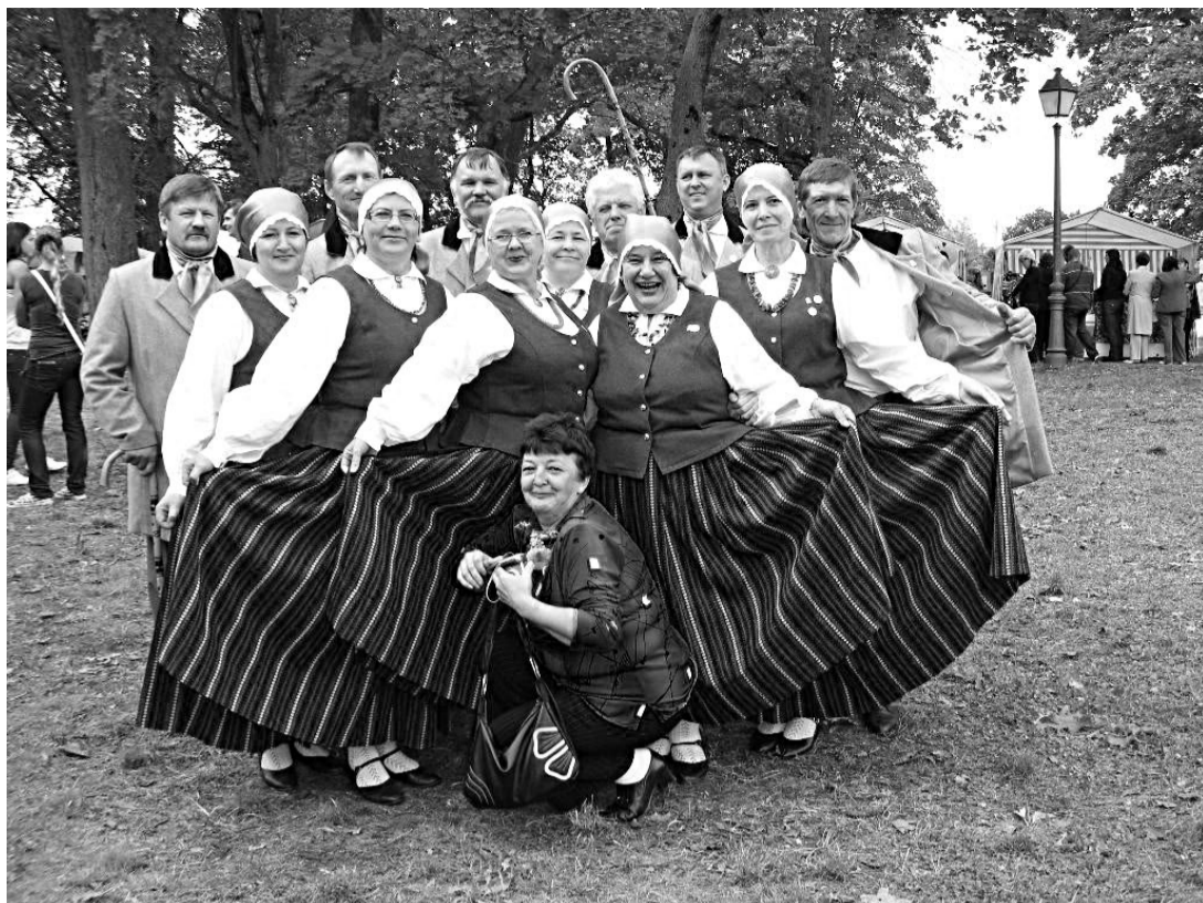
Svitenes deju kopas „Šurpu-turpu” dalībnieki priecēja svētku apmeklētājus Pakroja (Lietuva)

Š.g. 28.augustā Rundāles novads piedalījās Pakrojas rajona pašvaldības (Lietuva) rīkotajā tautas dziesmu un deju festivālā „Pulcēšanas Zemgaļu sētā”, kas tika rīkots Latvijas un Lietuvas pārrobežu sadarbības programmas projekta „Zemgales tradīcijas” ietvaros. Svitenes dejotāji „Šurpu – turpu” pārstāvēja novadu svētku koncertā.