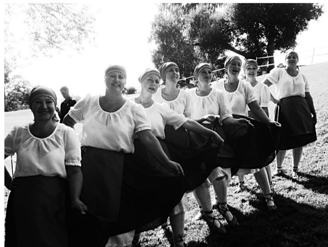
Deju kopa „Ir varianti” Kanepenes svētkos Skaistkalnē š.g. augustā