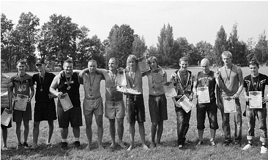
Labākie no labākajiem Rundāles novada vasaras sporta spēļu dalībniekiem

Šā gada saulainajā 14. augusta dienā notika Rundāles novada Vasaras sporta spēles, kurās varēja piedalīties un sportiski pavadīt brīvdienu ikviens Rundāles novada iedzīvotājs. Sporta spēļu dalībniekiem no Saulaines, Svitenes, Bērsteles un Viesturiem tika nodrošināts transports nokļūšanai uz sacensībām un mājās. Uzvarētājiem bija sagādātas medaļas, diplomu, kā arī pārsteiguma balvas. Kopumā godalgas tika izcīnītas 10 sporta veidos.