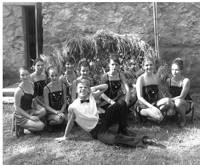
Teātra studija „Savējie” ar muzikālo izrādi „De ja vu” Ziedu svētkos Iecavā š.g. jūlijā

Sabiedrisko attiecību un projektu speciāliste