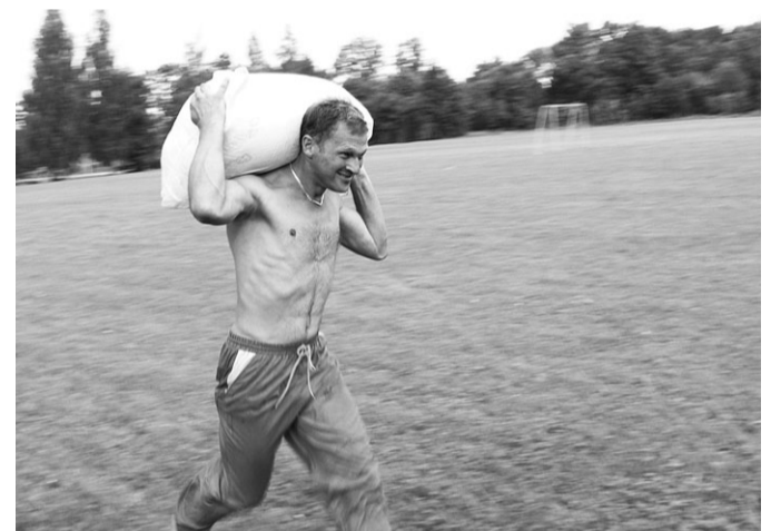
Vai viegli panest 50 kg graudu maisu?