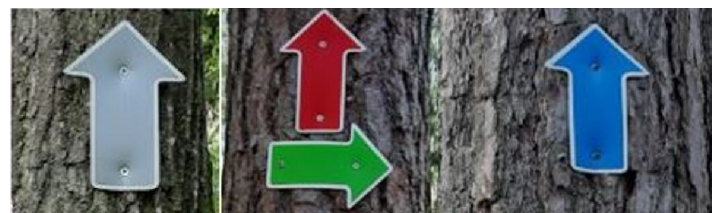
Taku marķējuma zīmes

Atkritumu regulāru savākšanu pie piemiņas vietas (0,1 ha) un piemiņas vietas uzturēšanu, par šiem darbiem noslēdzot sadarbības līgumu ar LVM.